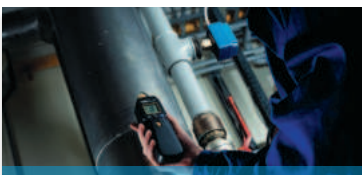
Messung physikalischer Größen