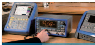
Messgeräte für die Elektronik