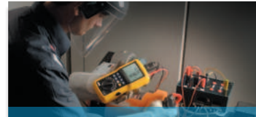
Messung, Erfassung und Analyse elektrischer Leistung & Energie