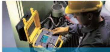
Messung & Prüfung der elektrischen Sicherheit