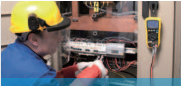
Messung bei Niederspannung