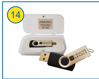
DataView® P01102095 Universelle Auswerte-Software für die Erstellung und Dokumentation von Prüfprotokollen gemäß ÖVE/ÖNORM E8001 inkl. Lizenznummer