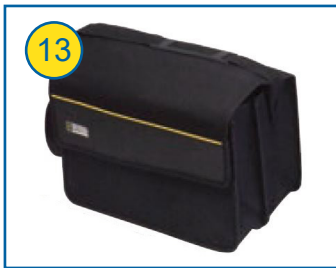
Transporttasche Nr. 22 P01298056 für Gerät und Zubehör (exkl. Erdungsmesszubehör), Abmessungen: 285 mm x 260 mm x 240 mm