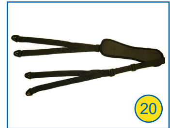
Umhängegurt für Freihandbetrieb P01298081