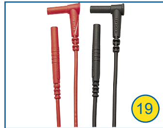
2x Sicherheits- messleitungen P01295094 2 Stk., je 1x rot, schwarz, 3 m lang, 600V Cat IV