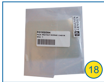
Kratzschutzfilm (1 Stk.) P01102094 schützt das Display vor Kratzern, selbstklebend