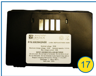
Akku P01296047 Lithium-Ion, 5,8 Ah, Akkubetriebsdauer: bis zu 24 Std. Betriebsdauer mit autom. Abschaltung des Gerätes Ladestation für Akku P01102130 (ohne Bild)