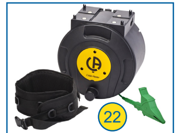
Leitungsroller 30m mit Gurt P01295492