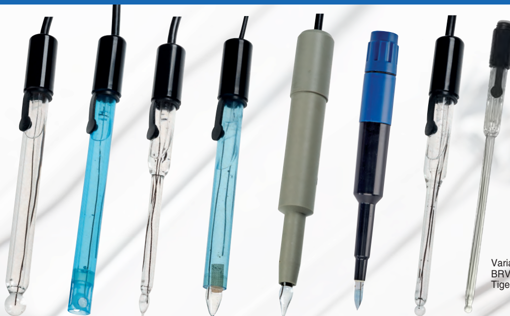
Variante BRV4H-S7-130 Tige de 130 mm