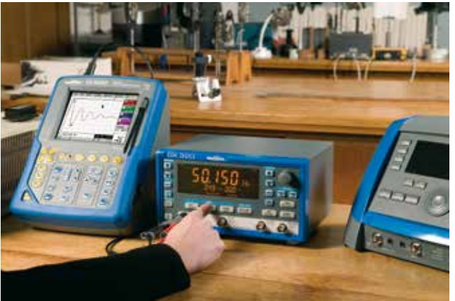
La fonction "salve" est très utilisée en optique notamment pour le contrôle qualité des cristaux.